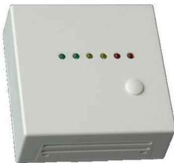
CO 2 Konzentration zu LED Status Liste: