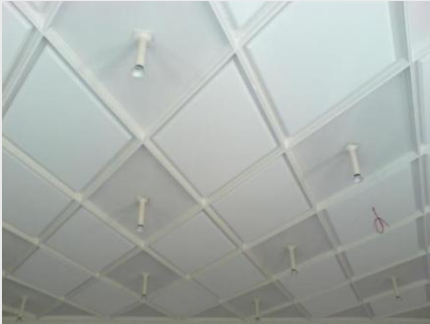
Absorber-Platten in Rautenform